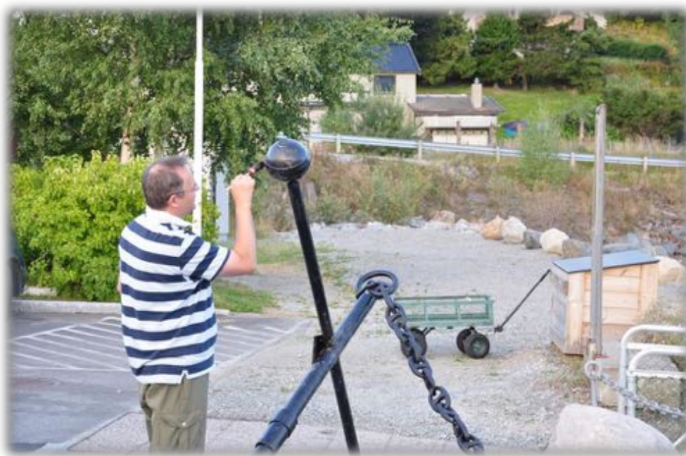
"Proff" maler